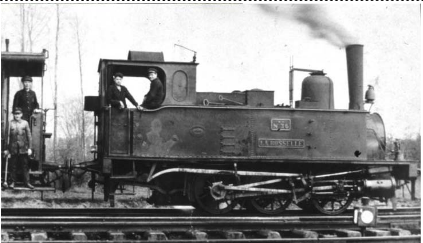
Locomotive 030T Koechlin type 50 « La Rosselle », n°W.H 36 (Wendel Hayange)

Au début du 20 ème siècle, le besoin en main d'œuvre pour l'exploitation minière est très grand. Les houillères embauchent à tour de bras, et grâce aux logements de fonction, avec jardins, le personnel se trouve regroupé dans des citées (qui proposent d'ailleurs un bon confort, peu répandu à cette époque) construites autour des villes proches des puits de mines. Pour faciliter les déplacements des mineurs vers leurs lieux de travail et retour, des lignes du réseau ferré industriel accueillent des trains pour le transport du personnel, trains qui desservent certaines villes et citées ainsi que des gares du réseau national (gares Elsass- Lothringen avant d'être Alsace-Lorraine puis SNCF) et des terminus accueillant les mineurs venant des campagnes avoisinantes.