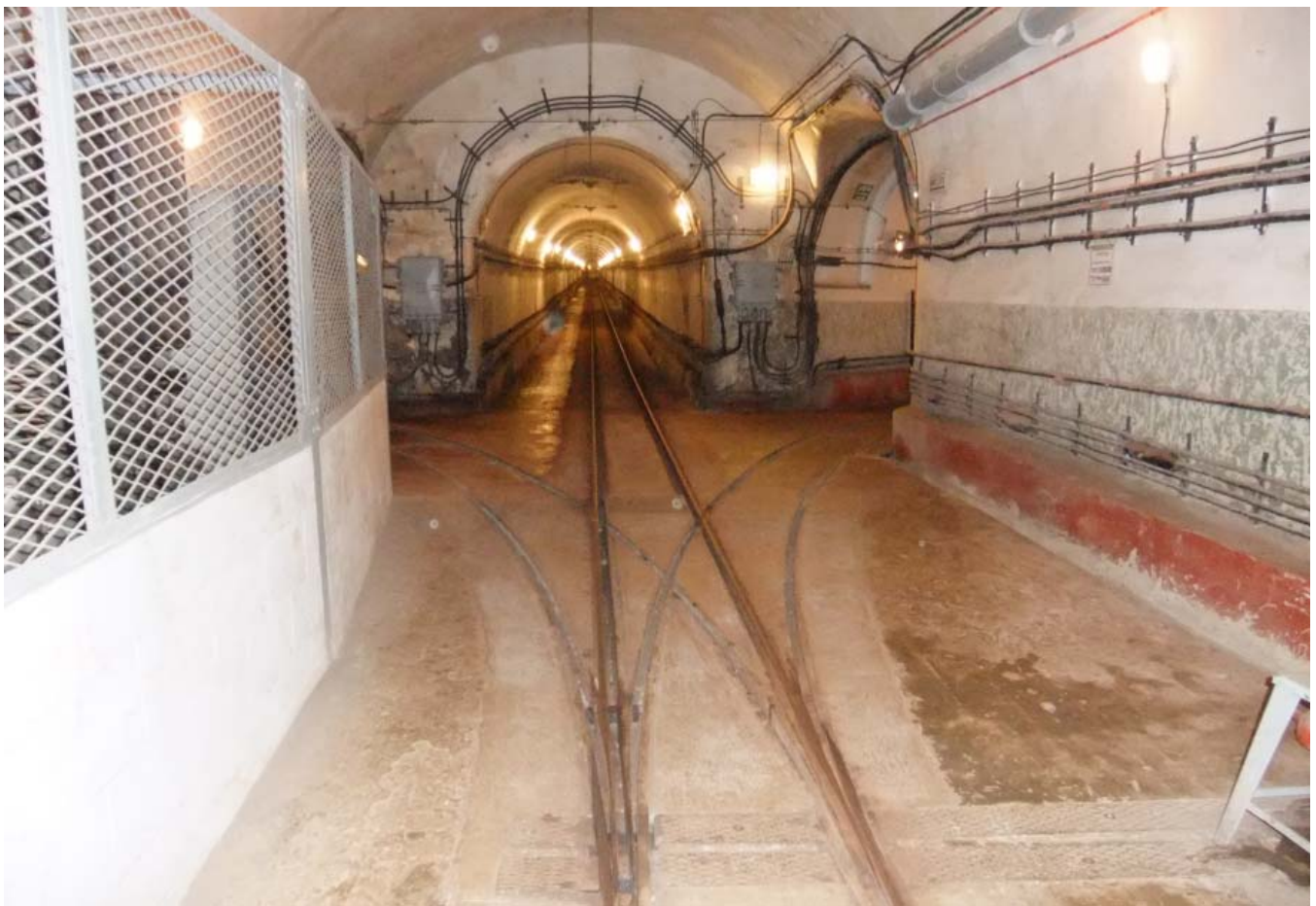
Trois des nombreuses galeries (pour rappel, il y a environ 10 km de galeries) - 10 juillet 2015

Le fort d'Hackenberg, qui se situe en Moselle sur la commune de Veckring (à environ 20 km à l'Est de Thionville), est un des nombreux ouvrages de la ligne Maginot. Il est l'un des deux plus importants de la ligne (avec l'ouvrage du Hochwald en Alsace) avec 16 blocs de combat (dont deux d'observation) et environ 10 km de galeries souterraines étendues sous 160 hectares de forêt. Ces galeries sont construites en béton armé d'au moins 3 m d'épaisseur, à au moins 30 m de profondeur afin d'être protégé en cas de bombardement. Le nom de Hackenberg vient du nom de la colline où il fut érigé et l'ouvrage porte aussi l'indicatif de « A 19 » au niveau militaire et comportait 25 canons et 32 mitrailleuses. Celui-ci fut construit entre 1929 et 1935 par environ 1800 ouvriers et coûta 171 millions de Francs de l'époque. Il abritait 1040 soldats et 43 officiers du 153 e Régiment d'Artillerie de Position (RAP) et du 164 e Régiment d'Infanterie de Forteresse (RIF).