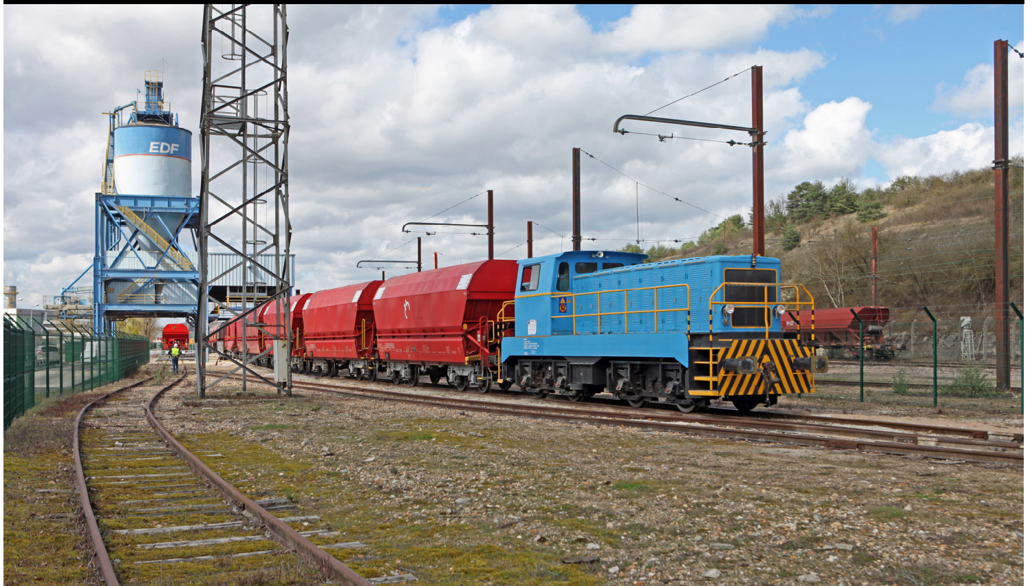
Vernou — La Celle — La Grande Paroisse — Seine & Marne 77 — EQIOM, groupe CRH & Socomat SGTL — c'est la BB diesel électrique Fauvet Girel CEM n°1 qui officie au déchargement de ce train de granulats. On observe à gauche les trémies marquées EDF qui servaient à expédier les cendres du temps du fonctionnement de l'ancienne centrale thermique de Montereau (charbon, puis fuel)