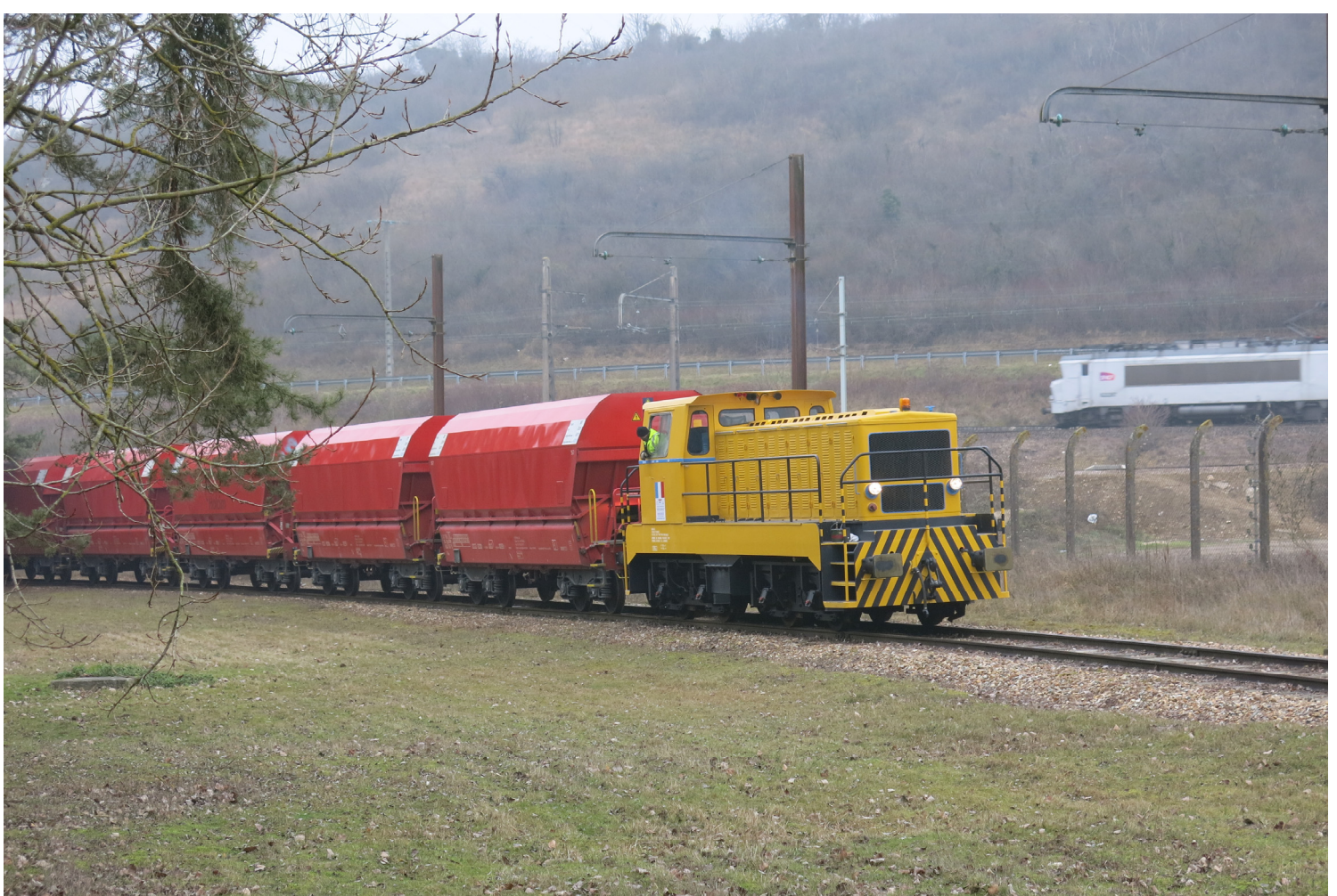
Vernou — La Celle — La Grande Paroisse — Seine & Marne 77 — EQIOM, groupe CRH & Socomat SGTL — La BB diesel électrique Fauvet Girel CEM n°2, n° constructeur 2 414 BB 5 de 1959, refoule la rame de wagons trémies qui vient d'être déchargée, tandis qu'un train passe sur la ligne de Montereau à Melun tracté par une BB22200