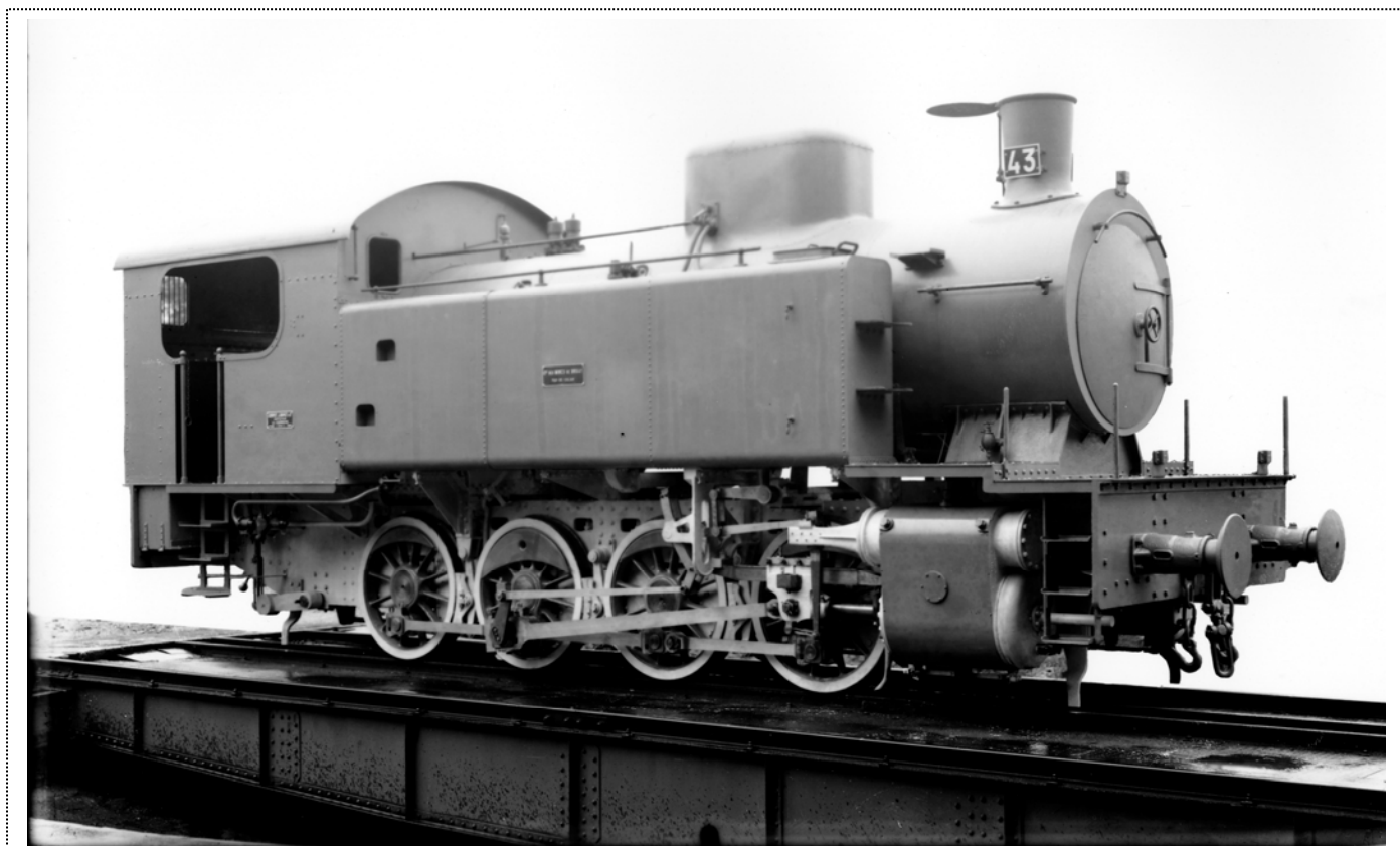
La locomotive Corpet n°1826, numéro d'exploitation 43 des Mines de Bruay, à sa sortie d'usine.

Ces machines industrielles présentent des solutions techniques modernes pour l'époque, comme par exemple des tiroirs cylindriques.