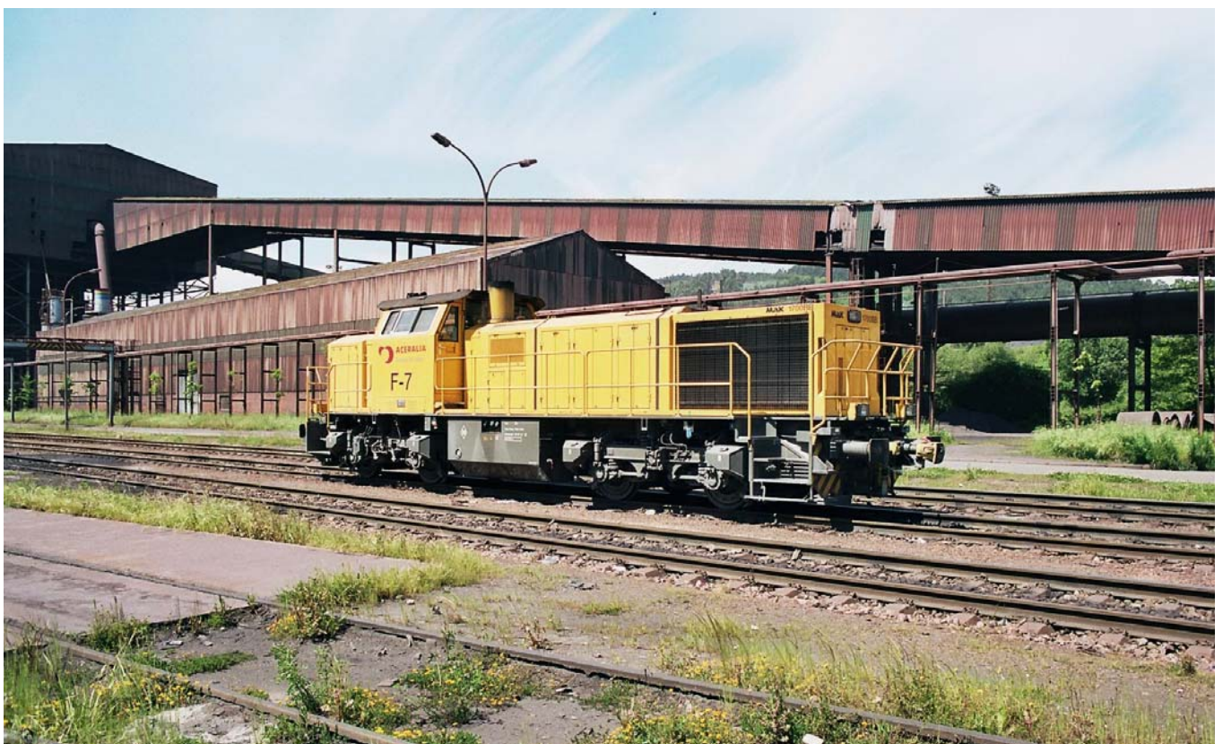
La locomotive de la série F n°7 stationne en relais à Veriña

Les deux machines d'AHV ont été mutées dans les Asturies en janvier 1997.