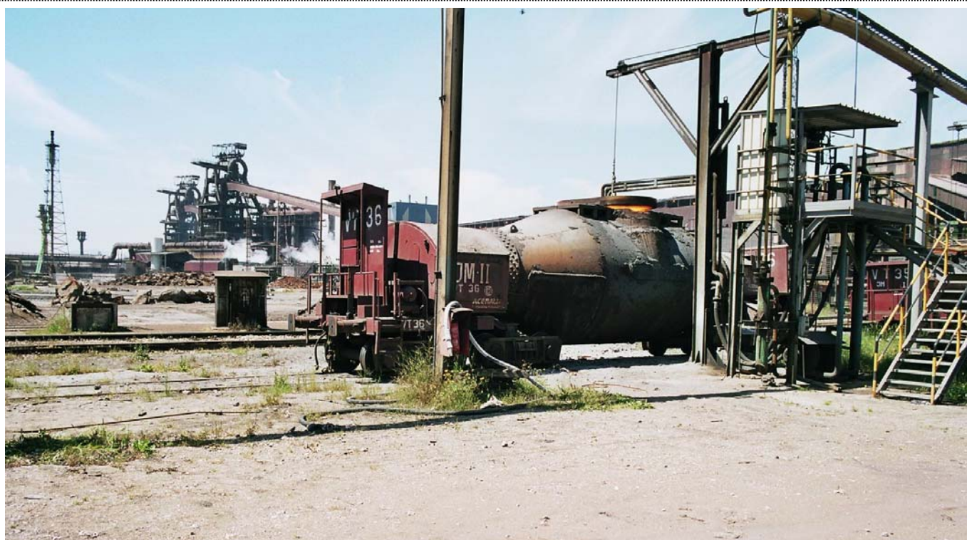
Les hauts fourneaux n°A & B de Veriña en arrière plan du wagon à poche torpille n°VT36. Les 3 wagons provenant de AHV possèdent également le marquage JM I à JM III

L'histoire d'Aceralia est liée à l'évolution des activités sidérurgique dans la péninsule Ibérique. Les premières concentrations industrielles débutent en 1902 avec la naissance d'Altos Hornos de Vizcaya (AHV). AHV provient de la fusion de trois entreprises : Altos Hornos de Bilbao, La Vizcaya et La Iberia. Lors de sa fondation, AHV est la plus grosse entreprise d'Espagne. Les implantations industrielles d'AHV se trouvent principalement à Vizcaya, Bilbao & Sagunto, à proximité des ressources en minerai de fer des environs de Bilbao, du port maritime de Bilbao, dans une région de tradition métallurgique.